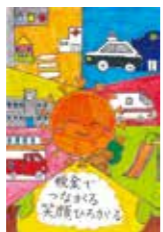
仙台中法人会 会長賞