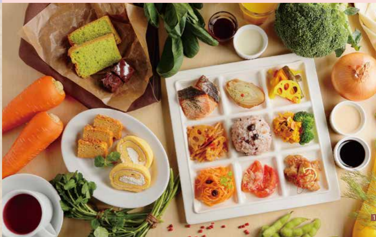
1 野菜や肉を使ったメインディッシュのほか、フルーツ、シフォンケーキやロールケーキなどのデザートまで。多彩なメニューが並ぶ 2 スタッフの皆さん 3 店内は白を基調とし、明るく寛ぎやすい雰囲気