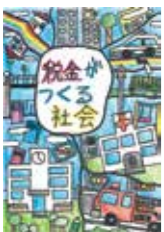
仙台中法人会 女性部会 部会長賞