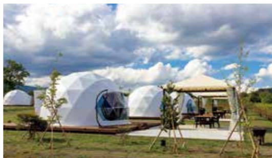
3千坪の広大な敷地にグランピング設備が6区画とオートキャンプ場3区画。ドーム間のプライバシーも確保されており、快適に過ごせる

したのは、コロナの影響だけでなくSNS等の情報過多で心が深刻に疲弊している人の多さ。「でも、大自然が人を癒せることもわかりました」と顔をほころばせる。「だからこそ施設を充実させたい。『密』な思い出を作ってほしいですから」。 大自然を思いっきり体感できるこの施設。誰かを誘うときは若ぶって、こうだ。 「ねえ、蔵王でチルしない？」