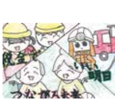
仙台中税務署 署長賞