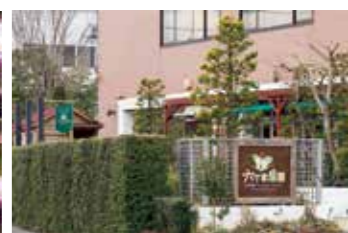
緑に囲まれた六丁目農園。あたたかくなるとテラス席が開放される

大人 2,480円 シニア(70歳以上) 2,280円 小学生 1,500円 3歳以上 700円 1~2歳 300円 0歳 無料 ※土日祝は200円追加(小学生以上) ※表示価格はすべて税込