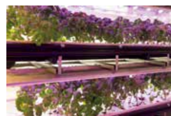
店内で水耕栽培しているバジルは、ソースの材料やサラダに