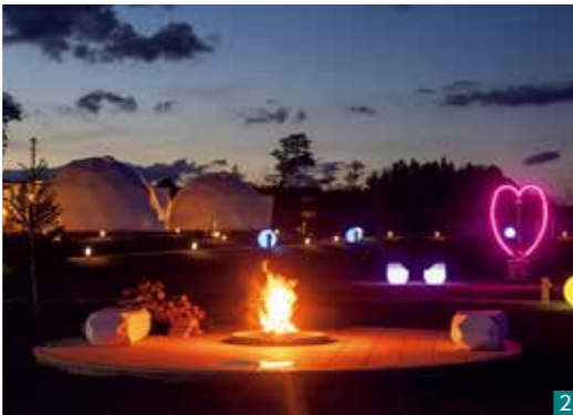
1 広い空間にシモンズ社製の快適なベッド、エアコン、冷蔵庫などを完備。ケージ付きのテントはペットと泊まることができ、敷地内にはドッグランも設けられている 2 ファイヤーピットエリア。揺らめく炎はいつまで眺めても飽きない 3 ポリウム満点の豪華なバーベキュー。オリジナルクラフトビールなどドリンクも充実 4 プライベートジャグジーでラグジュアリーな気分

遠刈田温泉郷から車で3分、蔵王連峰の麓にある「チルアウトグランピング蔵王」。 専用区画にテントと屋根付きBBQスペースがあり、一部にはプライベートジャグジーとシャワー室も。テント内は高級メーカカーのベッドに冷蔵庫、エアコンなどホテル並みの設備が揃う。WiFi完備でワーケーション需要にも対応し、ペットと泊まれる部屋もある。夕食は和牛やブランド豚、魚介、地元産野菜など豪華でポリウム満点のバーベキュー。職人が目の前で寿司を握ってくれるオプションも。遠刈田温泉共同浴場の無料チケットサービスもうれしい。夜にはキャンプファイヤーが焚かれ、ごく自然に人が集まって和やかな雰囲気が満ちる。 運営するのは蔵王町で和食店「宮壽司」を営む黒井昭寿さんだ。コロナ禍で打撃を受け、「密」を避けた野外で寿司を提供できないかと模索する中でグランピングに出会った。事業を始めて痛感