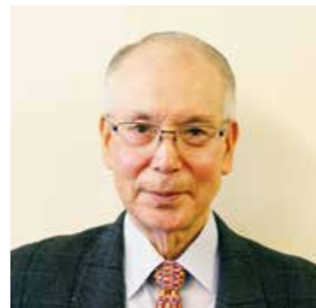
「私もラフターヨガに参加すると楽しくなりますし、皆さんの笑顔を見ることがうれしくなります」

したのは、コロナの影響だけでなくSNS等の情報過多で心が深刻に疲弊している人の多さ。「でも、大自然が人を癒せることもわかりました」と顔をほころばせる。「だからこそ施設を充実させたい。『密』な思い出を作ってほしいですから」。 大自然を思いっきり体感できるこの施設。誰かを誘うときは若ぶって、こうだ。 「ねえ、蔵王でチルしない？」