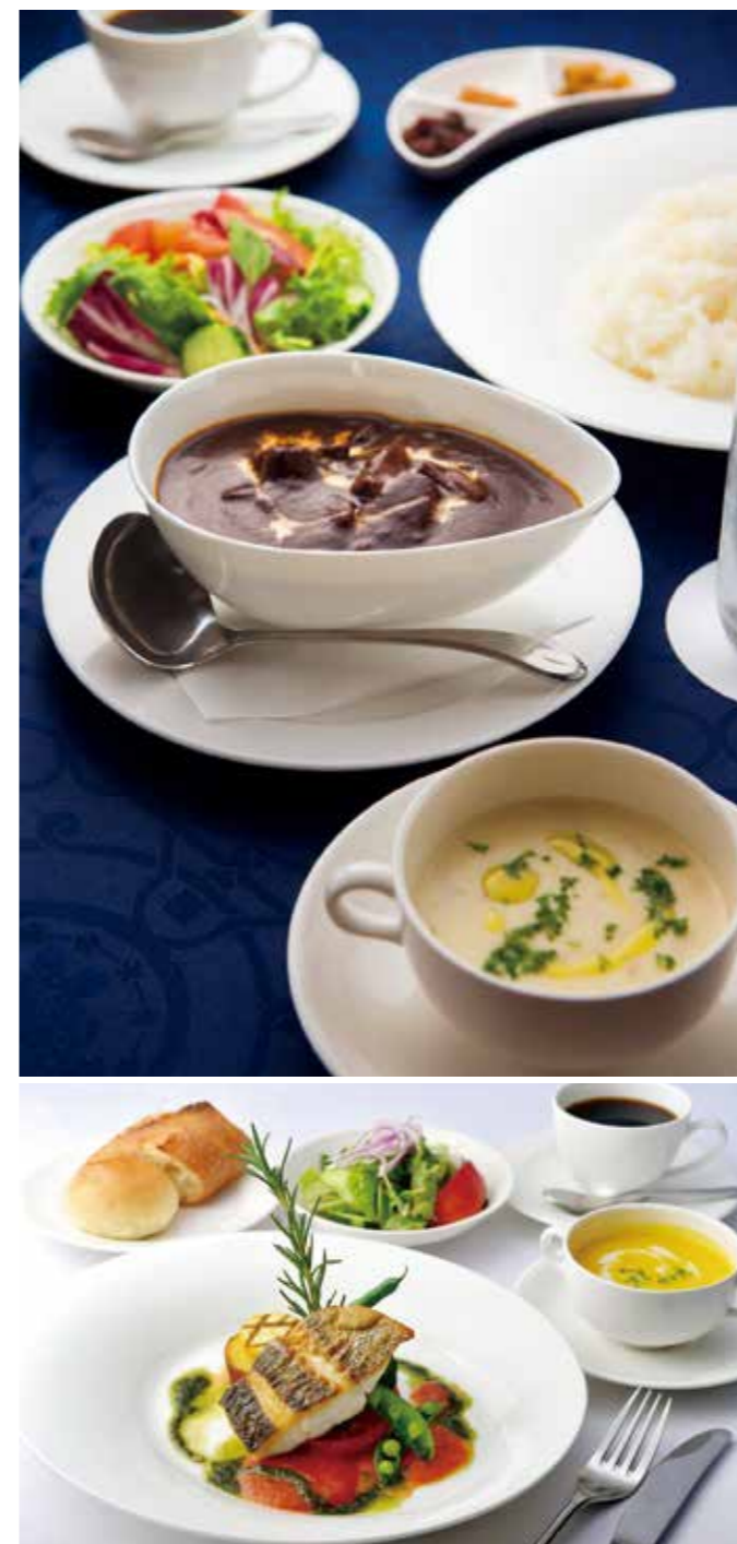
上/国産和牛使用 グルメカレー(2,000円)。独特な深みのある大人のカレーだ 下/肉・魚どちらか選べる日替わりランチメニュー(1,800円〜)。シェフがその日の 仕入れ食材に合わせてさまざまな調理法で提供してくれる(写真は魚ランチ)