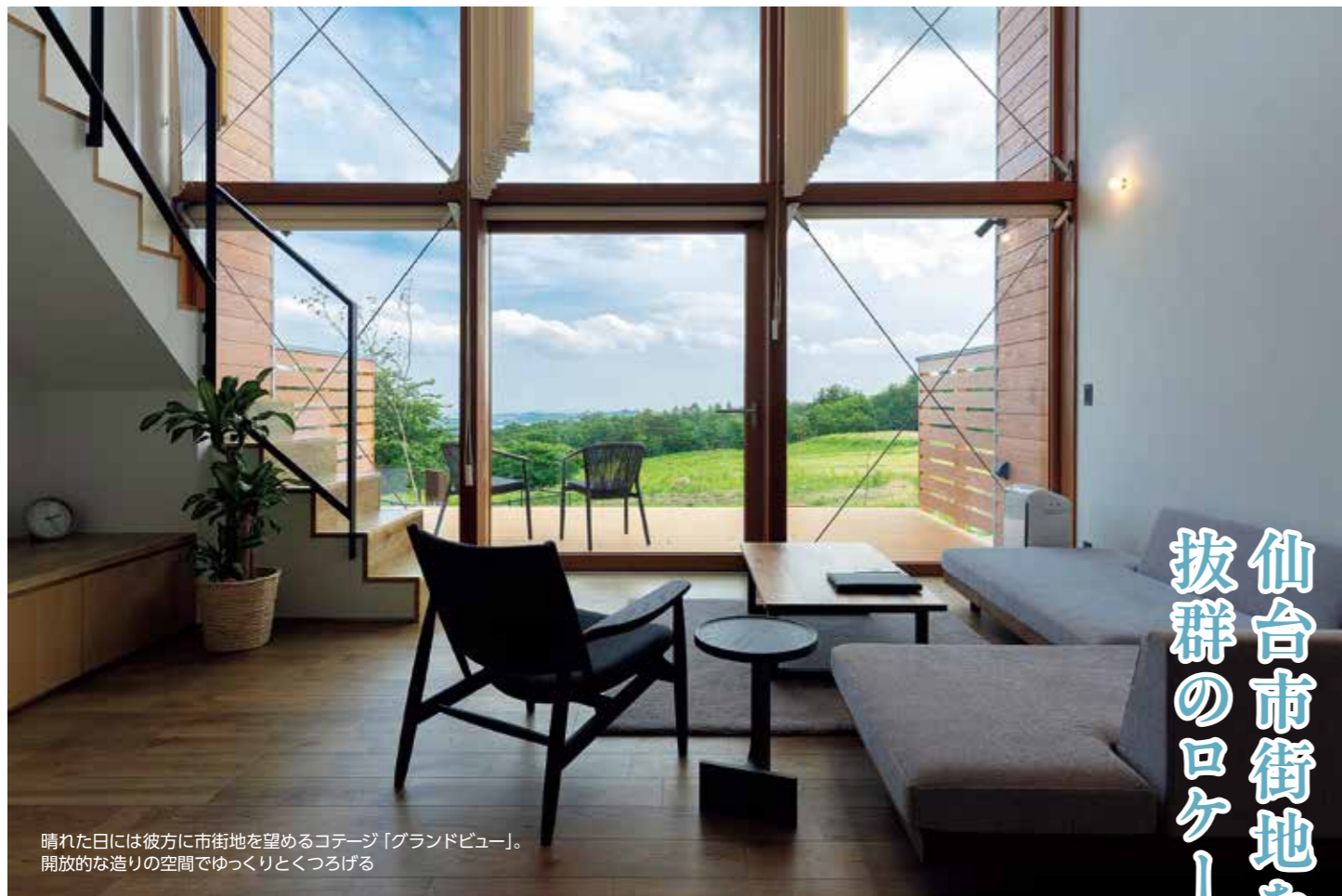
晴れた日には彼方に市街地を望めるコテージ「グランドビュー」。開放的な造りの空間でゆっくりとくつろげる