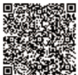
←仙台市防災水ハザードマップ サイト

ここで大切なのは、「すぐに対応ができる」ことを考えることです。建物の建替えなど時間がかかる対策は、今後の事業計画としておきます。