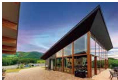
右/旬や土地を感じられる食材をふんだんに使ったコース。この日は「伊達イワナのバイ包み」や「日高見牛フィレ肉と牛タンのコムフィ」などが並んだ 左/三面ガラス張りで見晴らし抜群のレストラン&カフェ「ル・シエル」。カフェタイムは誰でも利用でき、多彩な軽食メニューを楽しむ

仙台市中心部から車で約40分。泉ヶ岳の中腹、標高500mほどの場所にある「泉ピークベース」は、仙台市街地や遠く太平洋まで見渡せる絶好のロケーションが魅力だ。キャンプサイトのほか、グランピングやコテージも備え、アウトドア初心者から上級者まで思い思いの滞在が叶う。 ベース内には温浴施設も。地下1310mから湧き出す天然温泉は、露天風呂からの眺めが抜群。日帰り入浴ができることから、スキーや登山の帰りに立ち寄る人も多い。 「仙台市内で、一番空に近いレストラン」を掲げるレストラン&カフェ「ル・シエル」も、この場所ならではの魅力のひとつ。ディナーで提供されるのは、カジュアルフレンチのコース料理。県産を中心に、こだわりの食材を使った料理の数々が並ぶ。朝の清々しい空気の中で味わうモーニングも好評だ。 仙台近郊にありながら、日常を離れたひとときを過ごせる泉ピーク