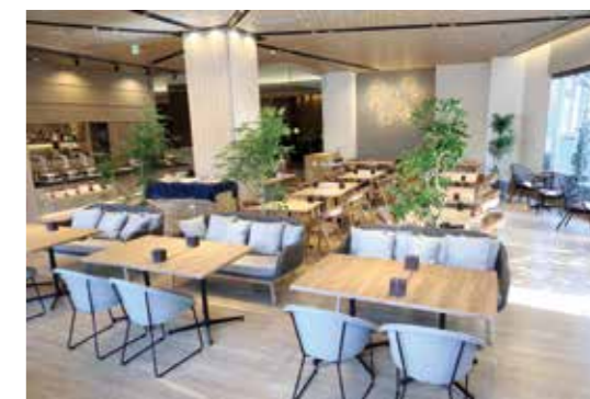
2022年にリニューアルオープン。あたたかな陽の光が差し込み、リラックスして過ごせる

やかさをプラスしている。トッピングは福神漬け、フライドオニオン、レーズンの3種類。ランチでもディナーでも注文できる。三品統括支配人は「誰にとっても馴染み深い料理であるカレーを、ここでしか食べられない味を提供したかった」と話す。完成には1年半の月日がかかったという。 ほかにも、月替わりランチメニューを3〜4種類用意。産地や旬の素材、季節感を切り口に、その都度異なるテーマで仕立ててい