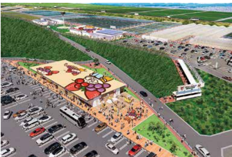
「JRフルーツパーク仙台あらはま 拡大計画」完成イメージ図。手前が新たに整備される隣接地

社員はみんな仲間であり、楽しく働ける会社であることが大切だと思います。 JR東日本では水戸・仙台・東京など3回の人事課長経験がありますが、規模の大きなJRでは細かい運用は難しいこともありましたが。当社は600人ほどの規模なので、一人ひとりをしっかり見ながら、適材